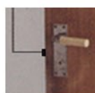
A-mått mäts till C/C (mitten) av låskolven